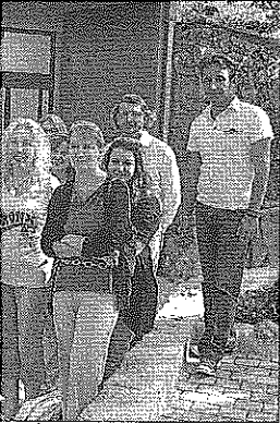
que de la grotte.