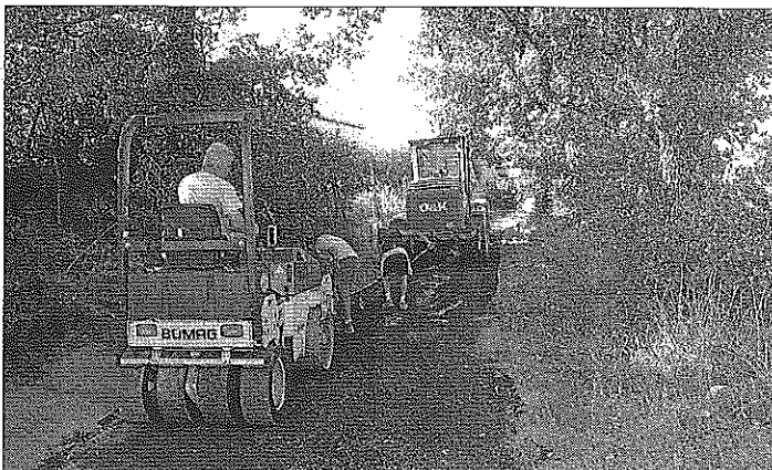
■ Les travaux de réfection du hameau de Bouc, terminés pour 2011.

La municipalité termine pour 2011 la dernière tranche des travaux de réfection des chemins. Le dernier tronçon du chemin de Grangeneuve a été réalisé avec de l'enrobé à chaud. Après le renforcement du réseau d'eau potable par les entreprises Pellet et Fiole Philippe, le chemin du hameau de Bouc à la station a, lui aussi, été entièrement refait avec une bi-couche. Après un rééquilibrage de la chaussée, le che-