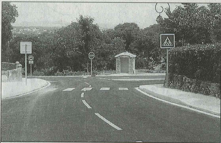
Le Conseil général a assuré le financement des travaux.

Les travaux ont apporté sécurité et visibilité au carrefour